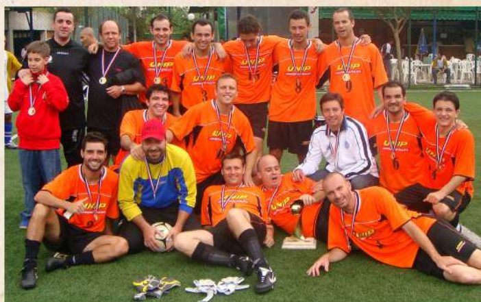
UNIP Bicampeã Paulista 2003

A edição de 2003 do campeonato da FPF7 foi paralisada por conta de uma ação ajuizada pela equipe do Colorado que interrompeu o torneio na fase semifinal. Classificada para a final, a UNIP ficou aguardando o adversário, mas, por conta de demora na decisão da Justiça, a partida não teve como ser realizada antes do término da temporada de 2003 - o jogo seria novamente contra a equipe do Veda Água, que também aguardava decisão da Justiça.