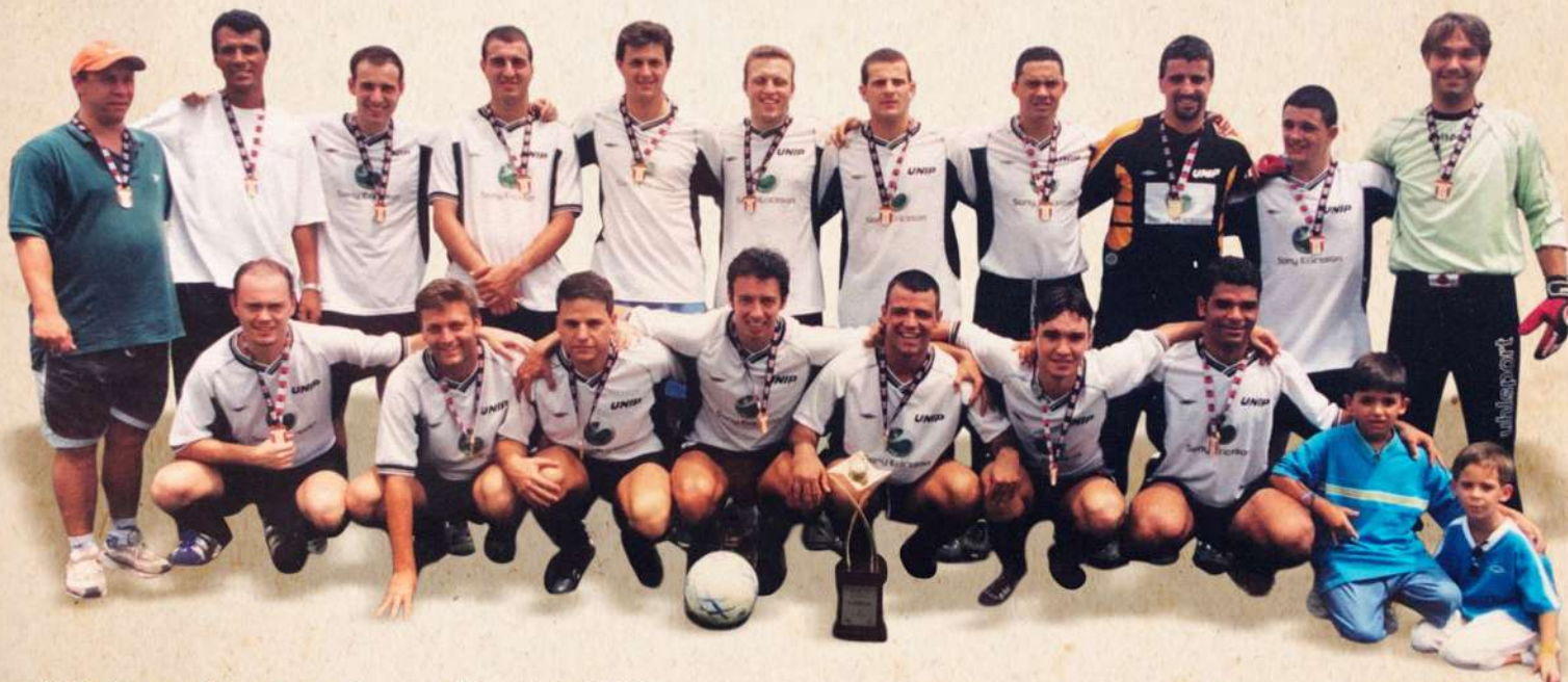
UNIP/Sony Ericsson - Campeã Paulista 2002

Em 2002, a UNIP fez história disputando o campeonato da Federação Paulista de Futebol 7 Society - FPF7. Em uma parceria com a empresa Sony Ericsson a equipe da UNIP/Sony Ericsson marcou 103 gols em 22 partidas, e sagrou-se pela primeira vez campeã paulista de futebol society em um torneio realizado por uma federação paulista oficial que reunia as principais equipes de São Paulo.