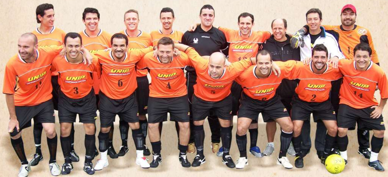
UNIP Bicampeã Paulista 2003 (Final realizada em 2005)

Após dois anos, quando finalmente as autoridades judiciárias chegaram a um veredito e liberaram a realização o jogo, mesmo já não havendo mais aquele contexto do campeonato de 2003, as equipes do Veda Água e da UNIP, com apoio da Federação, deram um show de fair play, realizando essa final simbólica em apenas uma partida, que ocorreu no clube Associação Atlética Banco do Brasil (AABB) - São Paulo, em 2005.