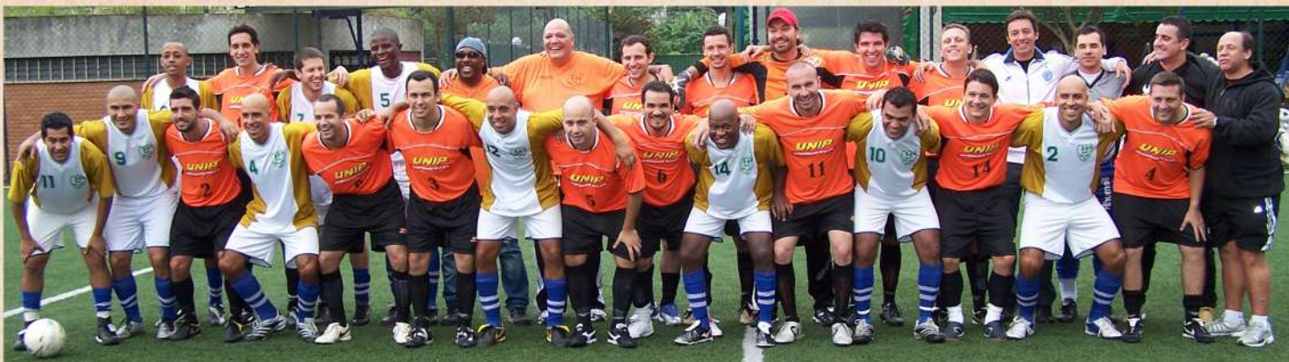
2003 - Final realizada em 2005. UNIP e Veda Água (Fair play)

Nessa final histórica, a UNIP novamente venceu a equipe do Veda Água, por 3x0, e levou o troféu de campeã paulista de 2003 para casa. Ao final da partida, as duas equipes fizeram um churrasco no clube para comemorar a realização do jogo.