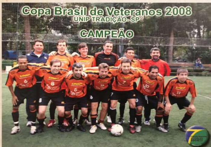
UNIP Tradição Campeão Paulista Veteranos

Com o passar dos anos, o futebol society também passou a fazer parte do calendário do esporte universitário, e a UNIP viria a montar equipes para participar dos campeonatos realizados pela Federação Universitária Paulista de Esportes - FUPE e pela Confederação Brasileira do Desporto Universitário - CBDU, tendo conquistado títulos nacionais nas categorias masculina e feminina.