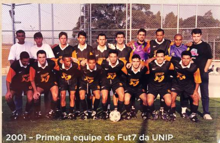
2001 - Primeira equipe de Fut7 da UNIP

O futebol society, também conhecido como Fut7 e futebol suíço, teve sua origem na década de 1980. No começo, era praticado em quadras de areia ou terra batida. Posteriormente, com a proliferação de quadras de grama sintética, a modalidade caiu no gosto dos praticantes de futebol, que começaram a disputar campeonatos em diversos centros esportivos de São Paulo.